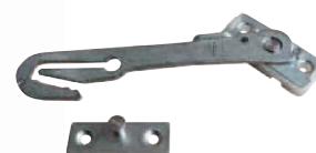
Kierstandhouder PN 3930