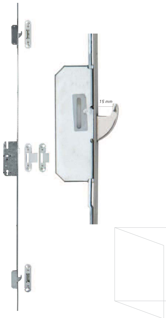
Draaideur Inbraakwerend volgens NEN 5096 (klasse 3) Naar binnen/Naar buiten draaiend bereikbaar Espagnolet HaKo 3000 (zonder nachtschoot)