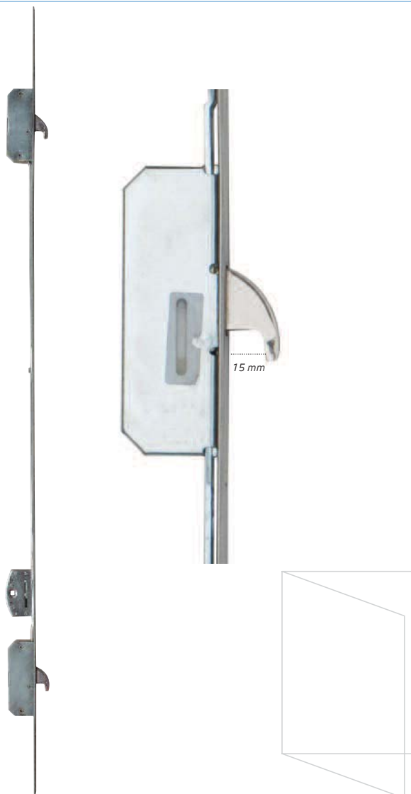
Draairaam Inbraakwerend volgens NEN 5096 (klasse 3) Naar binnen/Naar buiten draaiend bereikbaar Espagnolet HaKo 300