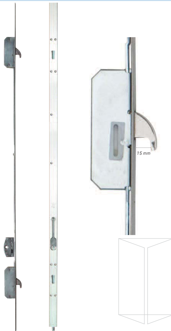
Stolpraam Inbraakwerend volgens NEN 5096 (klasse 3) Naar binnen/Naar buiten draaiend bereikbaar Espagnolet HaKo 300/98MP Stolpraam