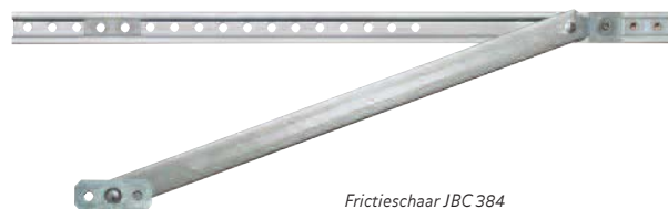
Frictieschaar JBC 384