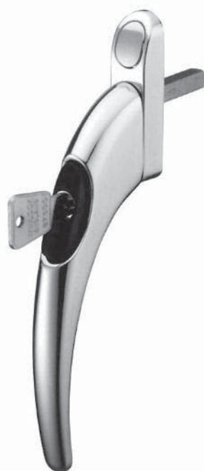
Winlock Bombardier raamkruk